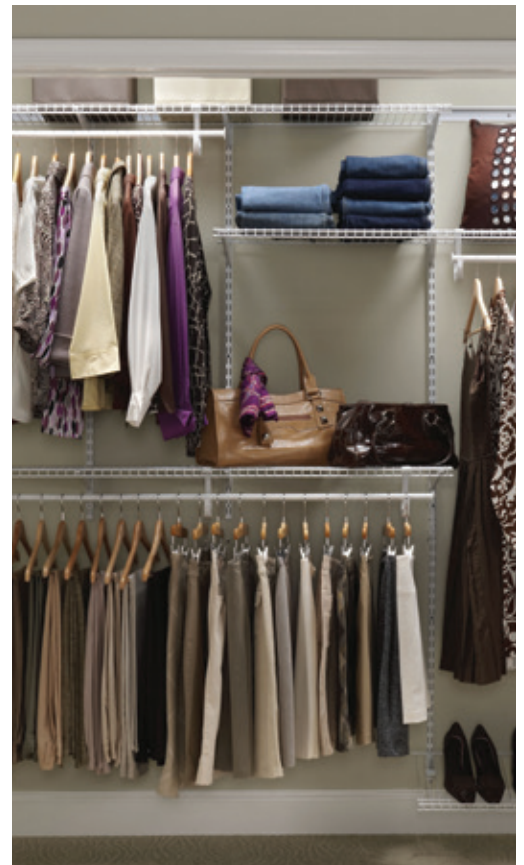
SHELFTRACK SUPERSLIDE EN BLANC